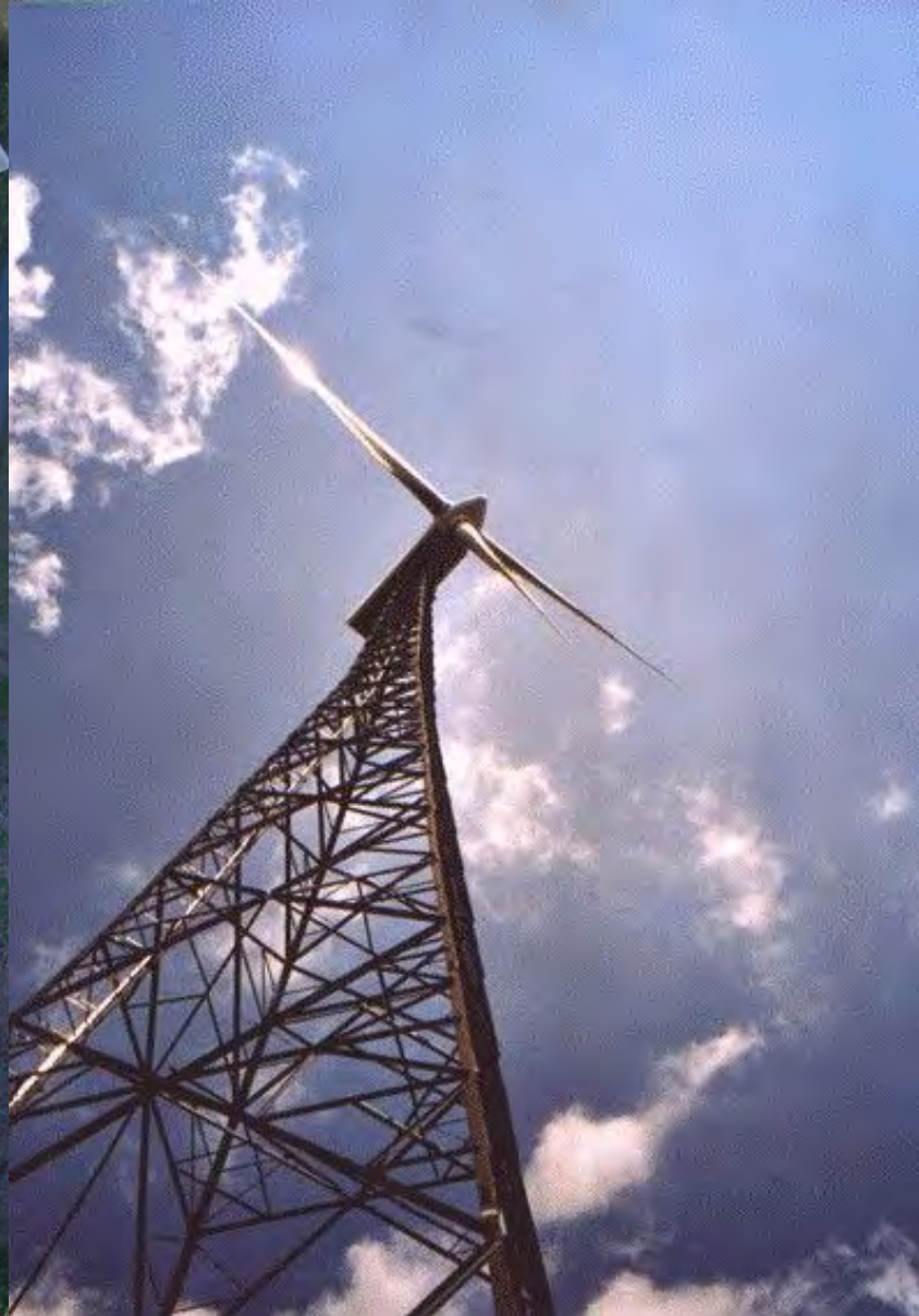
WEA „Ewiger Fuhrmann“ in Kreuztal die erste Wald-Windenergieanlage