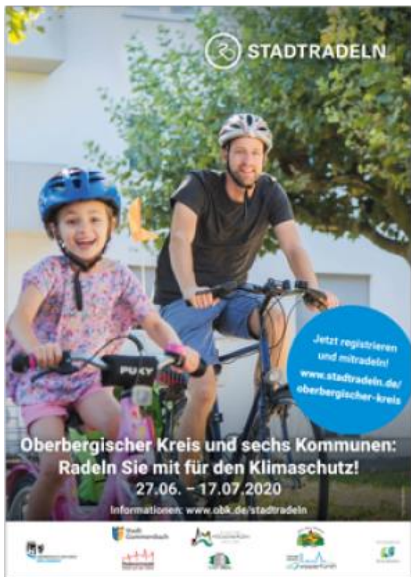
Plakat Stadtradeln im Oberbergischen Kreis 2020.

Die Bürgermeister der teilnehmenden Kommunen fordern Bürgerinnen und Bürger auf, mitzumachen: